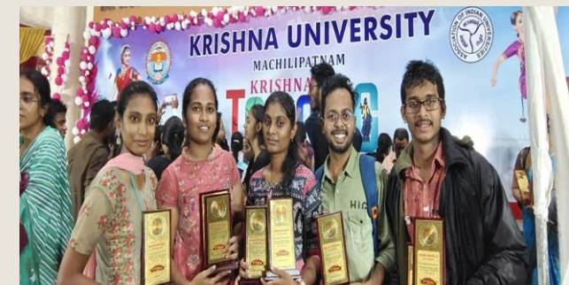
MBA students participated in Krishna University's Krishna Tarang (Youth Festival) during 9-10, December and won many prizes and contributed to College bagging Overall Championship.