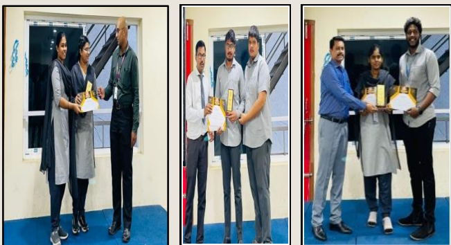
MBA students participated in the Management Meet on 12-12-2022 organized by the Department of Management Studies, Westin College, Vijayawada, and won 1 st prize in 3 events.