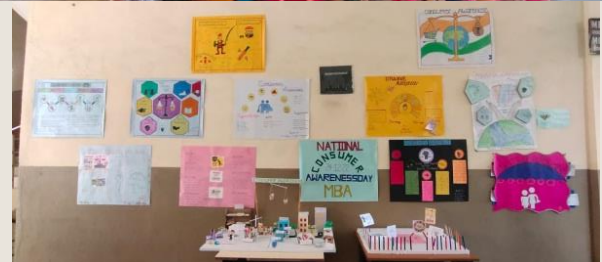
The Department of Business Administration organized the Poster presentation Competition under the Theme of Consumer Awareness conducted for Management Students on the occasion of National Consumer Day on 24-12-2022.