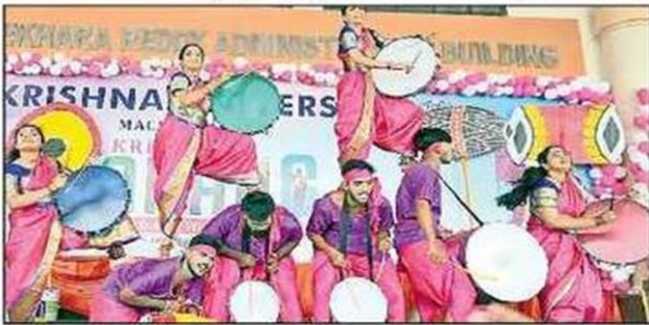
కృష్ణా ప్రదర్శనతో ఆకట్టుకున్న విద్యార్థులు

కృష్ణా విశ్వవిద్యాలయం (మచిలీపట్నం), న్యూస్టుడే: యువత తుల్లంత, కవ్విత, కేరెంతలతో కృష్ణా విశ్వవిద్యాలయం హోరెత్తింది. కృష్ణా తరంగ పేరిట రెండు రోజుల పాటు నిర్వహించిన యువజనోత్సవాలు శనివారం విజయవంతంగా ముగిశాయి. విశ్వవిద్యాలయంలో పాటు అనుబంధ కళాశాల విద్యార్థులు సైరా సై ఆంటూ పోటీపడ్డారు. కొందరు సంప్రదారు, జాన పద నృత్యాలతో ఆకట్టుకుంటే.. మరికొందరు పాశ్చాత్య బాడీలకు దిండు లేస్తూ కేకలు పెట్టినారు. ఇంకా వివిధ రకాల నాటికలు, గీతాలపసతో