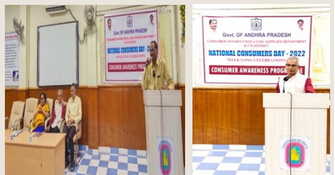
The Department of Business Administration organized the Poster presentation Competition under the Theme of Consumer Awareness conducted for Management Students on the occasion of National Consumer Day on 24-12-2022.