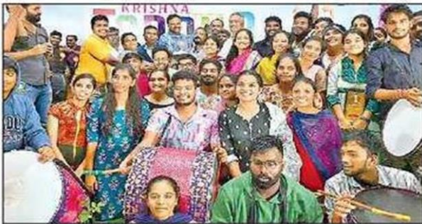
విజేతలతో ఉప కులపతి, రిజిస్ట్రార్ తదితరులు

కృష్ణా విశ్వవిద్యాలయం (మచిలీపట్నం), న్యూస్టుడే: యువత తుల్లంత, కవ్విత, కేరెంతలతో కృష్ణా విశ్వవిద్యాలయం హోరెత్తింది. కృష్ణా తరంగ పేరిట రెండు రోజుల పాటు నిర్వహించిన యువజనోత్సవాలు శనివారం విజయవంతంగా ముగిశాయి. విశ్వవిద్యాలయంలో పాటు అనుబంధ కళాశాల విద్యార్థులు సైరా సై ఆంటూ పోటీపడ్డారు. కొందరు సంప్రదారు, జాన పద నృత్యాలతో ఆకట్టుకుంటే.. మరికొందరు పాశ్చాత్య బాడీలకు దిండు లేస్తూ కేకలు పెట్టినారు. ఇంకా వివిధ రకాల నాటికలు, గీతాలపసతో